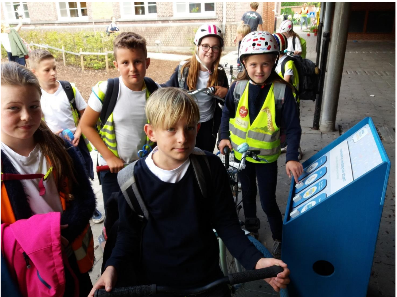
Foto: De leerlingen van basisschool Wonderwijzer geven elke dag met een druk op de knop aan hoe ze naar school kwamen. Download deze persfoto hier in hoge resolutie.

Nu vrijdag 20 september huldigt basisschool Wonderwijzer de eerste schoolstraat in Schilde en omstreken in. Die dag vragen ze iedereen om met de fiets of te voet naar school te komen. Met deze Strapdag-actie, middenin de Week van de mobiliteit, wil de school meer leerlingen én ouders overtuigen om vaker te kiezen voor stappen of trappen. En dat is nodig, want de cijfers die GoodPlanet het voorbije schooljaar verzamelde in 17 diverse scholen over heel België tonen nog veel ruimte voor verbetering.