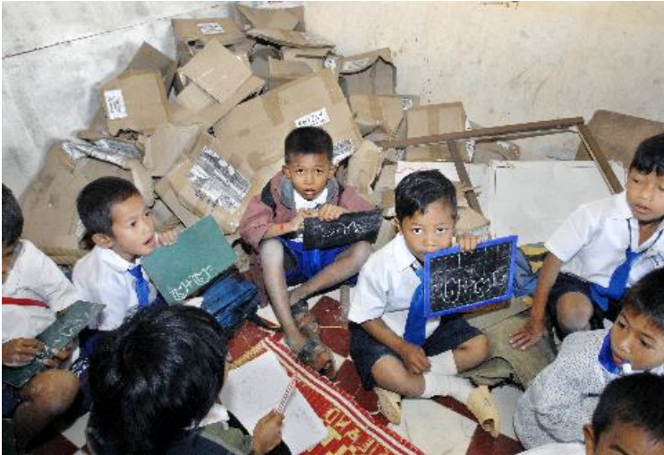
Cambodia, Siem Reap

Dit armtierig klaslokaal is inmiddels verleden tijd dankzij het Belgische BETT-project (Basic Education and Teacher Training) in Cambodia. Het project heeft onder meer als doelstelling om proefklassen te bouwen die uitgerust zijn op een adequate manier; met aangepast meubilair, krijtborden, sanitaire voorzieningen en toegang tot drinkbaar water.