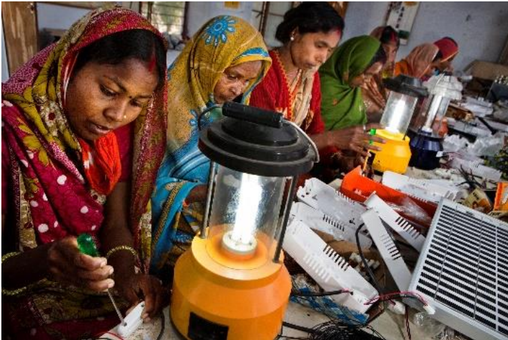
India, Rajasthan, Tilonia

Deze vrouwen volgen een cursus over toepassingen van zonne-energie in het Barefoot college of het Blote voeten-college . Het college geeft ongeletterde vrouwen een opleiding waarmee ze een inkomen kunnen verwerven. Na hun opleiding zullen deze Barefoot Solar Engineers specialisten zijn in het maken, plaatsen en herstellen van zonnepanelen en zonnekokers.