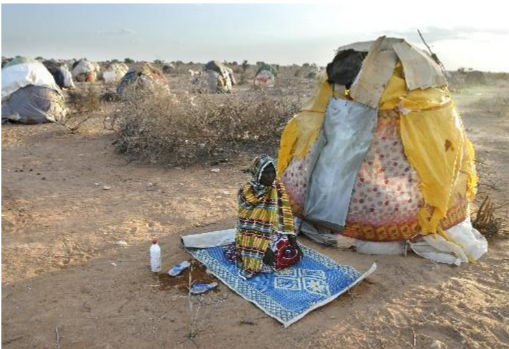
Kenia, El Wak

Deze boer en zijn zoon werden afgescheiden van hun dorp door de bouw van de acht meter hoge Israëlische Westoeverbarrière. Deze muur werd gebouwd doorheen het land waar vroeger zijn groenteserres stonden. Zijn burens zijn nu Israëlische kolonisten in de industriële nederzetting Elkana.