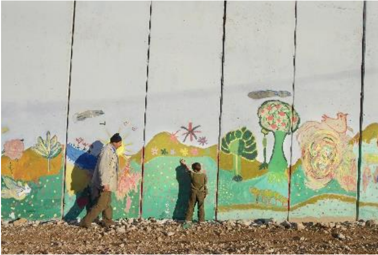
Palestijnse Gebieden, West Bank, Masha

Deze boer en zijn zoon werden afgescheiden van hun dorp door de bouw van de acht meter hoge Israëlische Westoeverbarrière. Deze muur werd gebouwd doorheen het land waar vroeger zijn groenteserres stonden. Zijn burens zijn nu Israëlische kolonisten in de industriële nederzetting Elkana.