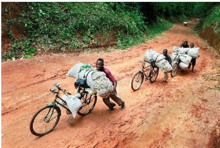
Democratische Republiek Congo, Kikwit

Deze vrouwen volgen een cursus over toepassingen van zonne-energie in het Barefoot college of het Blote voeten-college . Het college geeft ongeletterde vrouwen een opleiding waarmee ze een inkomen kunnen verwerven. Na hun opleiding zullen deze Barefoot Solar Engineers specialisten zijn in het maken, plaatsen en herstellen van zonnepanelen en zonnekokers.