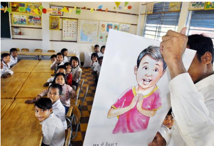
Cambodia, Siem Reap

Dit armtierig klaslokaal is inmiddels verleden tijd dankzij het Belgische BETT-project (Basic Education and Teacher Training) in Cambodia. Het project heeft onder meer als doelstelling om proefklassen te bouwen die uitgerust zijn op een adequate manier; met aangepast meubilair, krijtborden, sanitaire voorzieningen en toegang tot drinkbaar water.