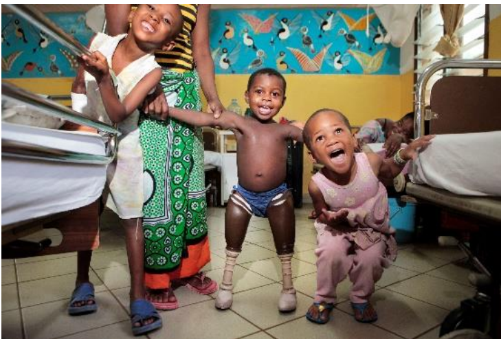
Tanzania, Dar es Salaam

Een rij latrines naast een beekje in de sloppenwijk Mukura-Kayaba. Gebruik van deze latrines kost 3 Keniaanse shillings, ongeveer 2 eurocent. Velen verkiezen een gratis plekje buiten naast het beekje. Vandaag hebben wereldwijd 2,4 miljard mensen geen toegang tot sanitaire basisvoorzieningen. Meer dan 900 miljoen mensen moeten hun behoeften in open lucht doen.