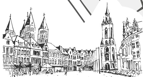
Grote Markt & Belfort